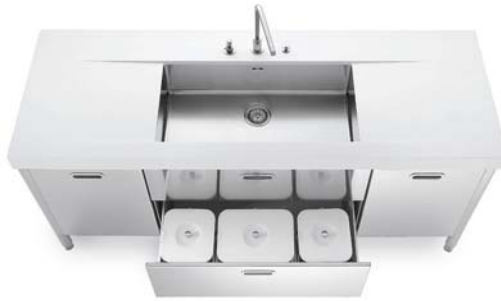
Vasca sottopiano, top in Corian®, due ante e due cassetti inox, raccolta differenziata. Unterbaubecken, Corian®-Arbeitsplatte, zwei Edelstahltüren und zwei Schubladen, getrennte Müllsammlung.