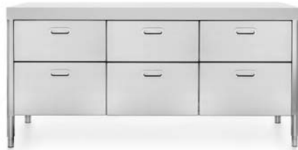
Top in Corian®, sei cassetti inox. Corian®-Arbeitsplatte, sechs Edelstahlschubladen.