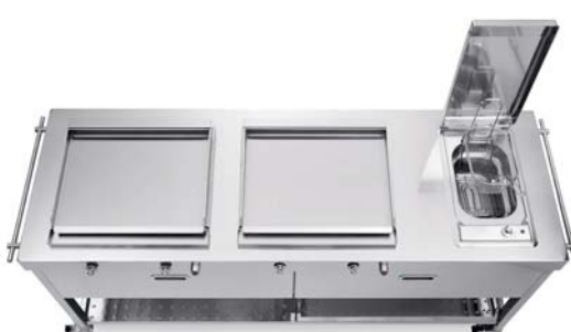
Carrello con top inox, due piastre cottura inox a gas, friggitrice elettrica. Auf Rollen montierte Arbeitsbank mit Edelstahl-Arbeitsplatte, zwei Edelstahl-Gaskochfelder, elektrische Fritteuse.