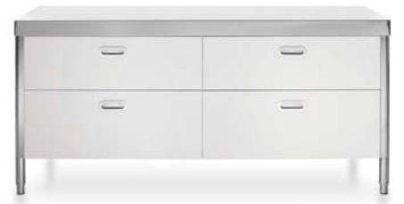
Top inox, quattro cassetti in laccato bianco. Edelstahlplatte, vier weißlackierte Schubladen.