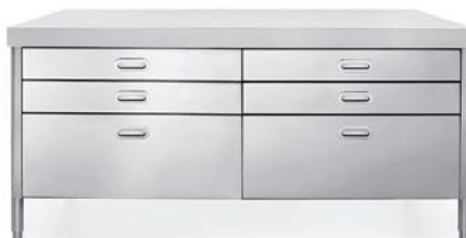
Top in Corian®, sei cassetti inox. Corian®-Arbeitsplatte, sechs Edelstahlschubladen.