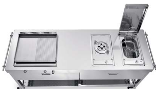
Carrello con top inox, piastra cottura inox a gas, piano cottura fuoco singolo con tripla corona, friggitrice elettrica. Wagen mit Edelstahl-Arbeitsplatte, Gas-Edelstahlkochplatte, Einzelkochfeld mit Dreifachbrenner, elektrische Fritteuse.