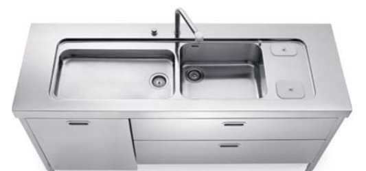
Lavello integrato al top inox con raccolta differenziata dall'alto, due cassetti e anta per lavastoviglie inox. In die Edelstahl-Arbeitsplatte eingeschweißte Spüle mit differenzierter Müllsammlung von oben, zwei Edelstahlschubladen und Tür für das Geschirrspülmodul.