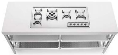
Piano cottura ad incasso con cinque fuochi a gas in linea e quattro ripiani estraibili inox. Einbaukochfeld mit fünf aneinandergereihten Gasbrennern und vier herausnehmbaren Edelstahlablagen.