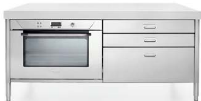
Forno elettrico multifunzione con porta fredda, tre cassetti inox. Elektro-Multifunktionsbackofen mit gekühlter Tür, drei Edelstahlschubladen.