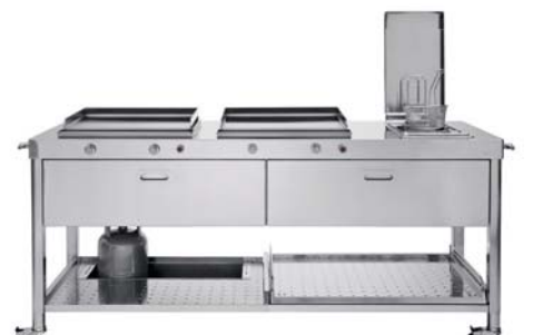
Carrello con top inox, piastra cottura inox a gas, friggitrice, due cassetti inox, ripiano estraibile e porta bombola. Auf Rollen montierte Arbeitsbank mit Edelstahl-Arbeitsplatte, Gaskochplatte, Fritteuse, zwei Edelstahlschubladen, herausziehbare Ablage und Gasflaschenablage.