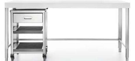
Carrello sotto top con un cassetto e due ripiani estraibili inox. Wagen unter der Arbeitsplatte mit einer Schublade und zwei herausziehbaren Edelstahlablagen.