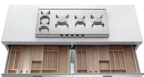
Piano cottura ribaltabile con cinque fuochi a gas in linea, top in Corian®, cassetti attrezzati. Klappkochfeld mit fünf aneinandergereihten Gasbrennern, Corian®-Arbeitsplatte, Schubladen mit Einsätzen.