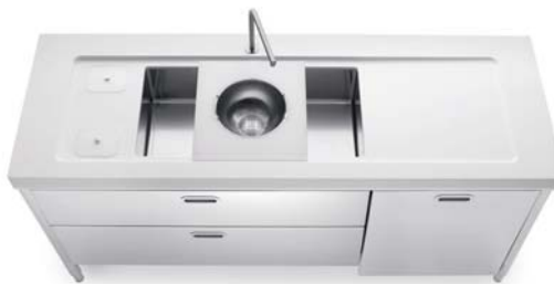
Vasca sottopiano, top in Corian®, due cassetti e anta per lavastoviglie inox, raccolta differenziata. Unterbaubecken, Corian®-Arbeitsplatte, zwei Edelstahlschubladen und Tür für das Geschirrspülmodul, getrennte Müllsammlung.