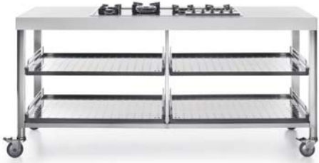
Piano cottura ad incasso e quattro ripiani estraibili inox. Einbaukochfeld und vier herausziehbare Edelstahlablagen.