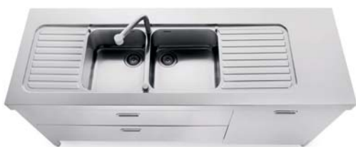
Lavello integrato al top inox con due vasche e due scivoli, due cassetti e anta per lavastoviglie inox. In die Edelstahl-Arbeitsplatte eingeschweißte Spüle mit zwei Becken und zwei Tellerablagen, zwei Schubladen und Tür für das Geschirrspülmodul.