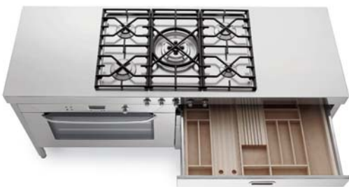
Piano cottura con cinque fuochi a gas, griglia in ghisa, comandi frontali, top inox. Grande forno elettrico e cassetti attrezzati. Kochfeld mit fünf Gasbrennern, Gussroste, stirnseitige Bedienelemente, Edelstahlplatte. Großer Elektrobackofen und Schubladen mit Einsätzen.