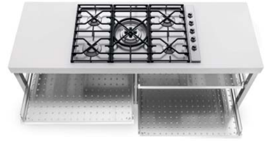
Piano cottura ad incasso con cinque fuochi a gas, griglia in ghisa, comandi laterali e quattro ripiani estraibili inox. Einbaukochfeld mit fünf Gasbrennern, Gussroste, seitliche Bedienelemente und vier herausziehbare Edelstahlablagen.